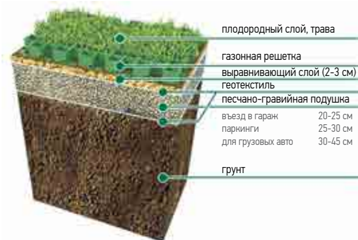
Схема обустройства газона с использованием газонной решетки

Маркеры выпускаются в двух цветах: белый и желтый. Предназначены для газонной решетки арт. 8101-3.