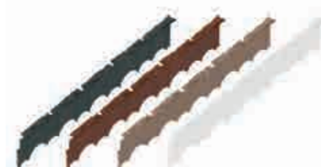
арт. 8201-Ч арт. 8201-П арт. 8201-Т арт. 8201-СМ